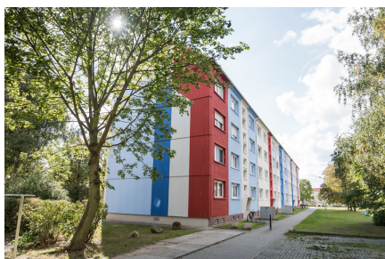
Objektansicht Fr.-Engels-Str. 65

Wohnhaus Friedrich-Engels-Strasse 59 - 67 04509 Delitzsch 3-Raumwohnung Maßstab 1 : 75