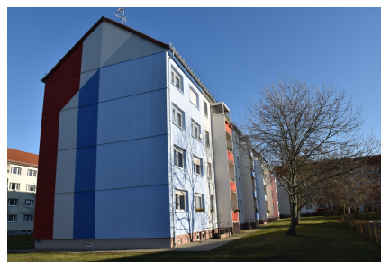
Rückansicht Fr.-Engels-Str. 65